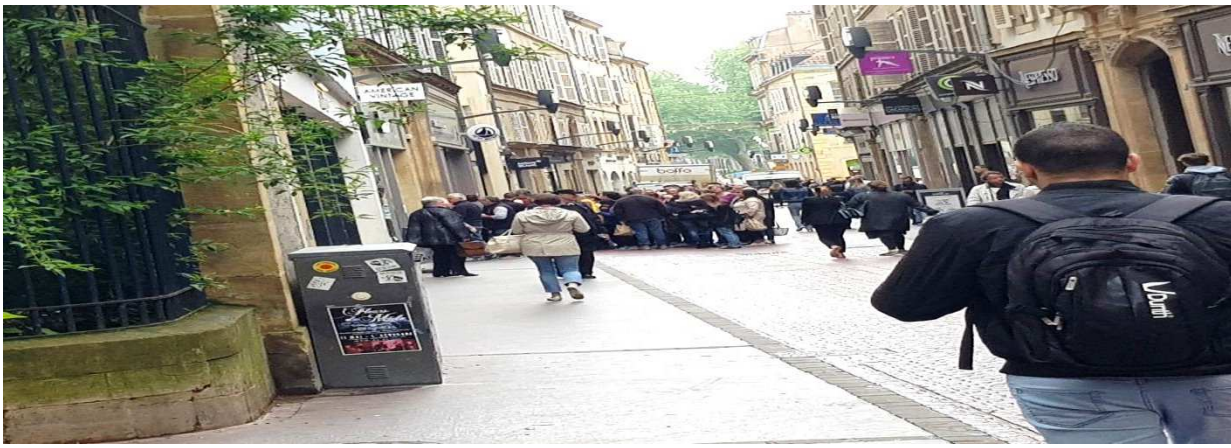
Pendant ce temps la, Rue des Clercs (Mai 2018)